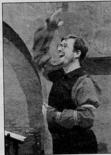
Charles Barbier, une direction jubilatoire

Les chanteurs explorent avec le public l'ensemble des espaces de l'église Saint-Etienne: pour introduire le concert avec les hymnes mystiques du Libre Vermell de Montserrat , du XIV e siècle, ils partent de l'entrée en chantant pour gagner les stalles du chœur en procession; puis, sur l'estrade coutumière, deux motets et la messe O Magnum Mysterium de Tomás Luis da Vittoria nous font voyager entre tristesse, méditation et jubilation. Apparemment sans effort, les chanteurs font ressortir les registres à tour de rôle et avec pertinence, mettant les motifs en relief: un régal de finesse presque picturale. Après le ressac chatoyant du Ave Virgo Sanctissima de Francisco Guerrero, l'ensemble vocal se sépare en deux, quitte l'estrade pour les bas-côtés et revient à Vittoria pour deux pièces à double chœur: Ave Regina Cae-